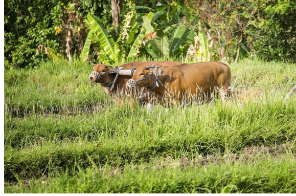
Ploegen met hulp van koeien

In Indonesië kom je andere huizen tegen dan in Nederland. Vrijwel alle huizen zijn van hout. Dat is dan ook in grote getalen te vinden. Indonesië heeft veel tropische bossen. De huizen hebben vaak geen ramen. Het is er immers altijd rond de 28 graden. Een voorbeeld van een huis kun je zien op het plaatje hieronder.