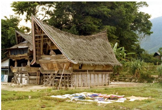
Typische huizen van hout en stro

In Indonesië kom je andere huizen tegen dan in Nederland. Vrijwel alle huizen zijn van hout. Dat is dan ook in grote getalen te vinden. Indonesië heeft veel tropische bossen. De huizen hebben vaak geen ramen. Het is er immers altijd rond de 28 graden. Een voorbeeld van een huis kun je zien op het plaatje hieronder.