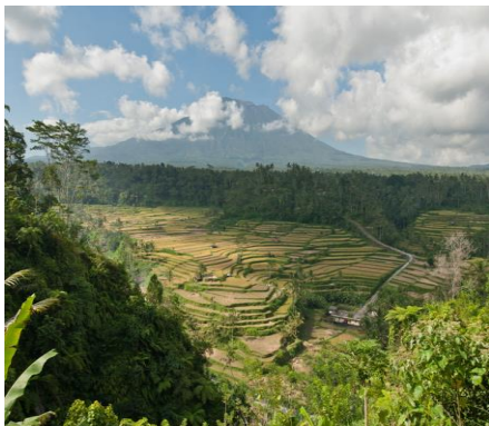
Voorbeeld van het landschap in Indonesië, met landbouwvelden, bergen en tropische bossen

Naast het tropisch regenwoud komt je in Indonesië hoge bergen, landbouwgronden en rivieren tegen. En er zijn natuurlijk dorpen en steden.