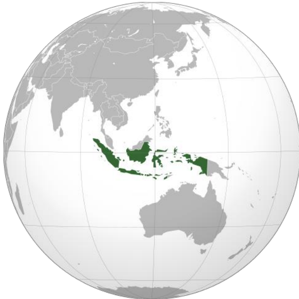
Wereldkaart met Indonesië (in donkergroen).

Indonesië ligt in Zuidoost-Azië en bestaat uit wel 14.572 eilanden. Als je zandbanken en koraalriffen ook mee telt, kom je zelfs rond de 18.000 uit. De meeste van de deze eilanden zijn onbewoond. Op het eiland Java ligt de hoofdstad Jakarta. Om hier te komen moet je een flinke vlucht maken: rechtstreeks ben je wel 14 uur onderweg.