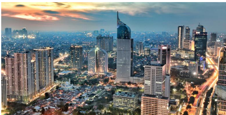
De hoofdstad Jakarta

De steden in Indonesië lijken op de steden zoals wij die kennen met veel inwoners, grote moderne gebouwen en veel verkeer op de weg. De mensen die in de steden wonen zijn vaak rijker dan de mensen in de dorpen. Daar kunnen grote verschillen in zitten.