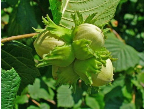
Hazelnoten, nog groen en onrijp aan de boom.

Naast de wilde hazelaar zijn er commercieel verbouwde hazelaars. Deze bomen hebben grote noten met weinig vliezen. De rassen zijn ontstaan uit kruisingen tussen diverse soorten. De kleinere noten van de wilde hazelaar worden echter gewaardeerd om hun meer uitgesproken smaak.