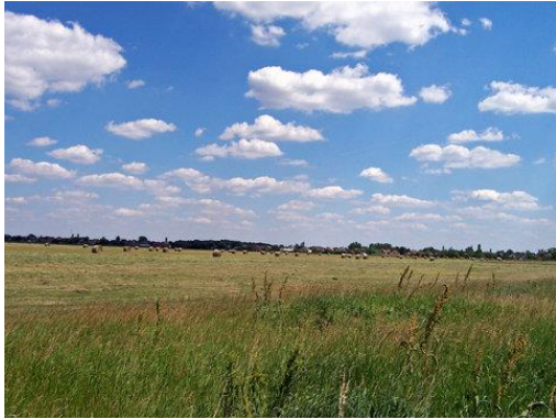
Grote Hongaarse laagvlakte

In het midden en zuidoosten van Hongarije ligt de Grote Hongaarse laagvlakte, een onderdeel van de Pannonische vlakte die zich in centraal/zuidoost Europa uitstrekt. Je hebt ook nog de Kleine Hongaarse Laagvlakte in het noordwesten. Het Balatonmeer, in het westen, is één van de grootste meren van Europa.