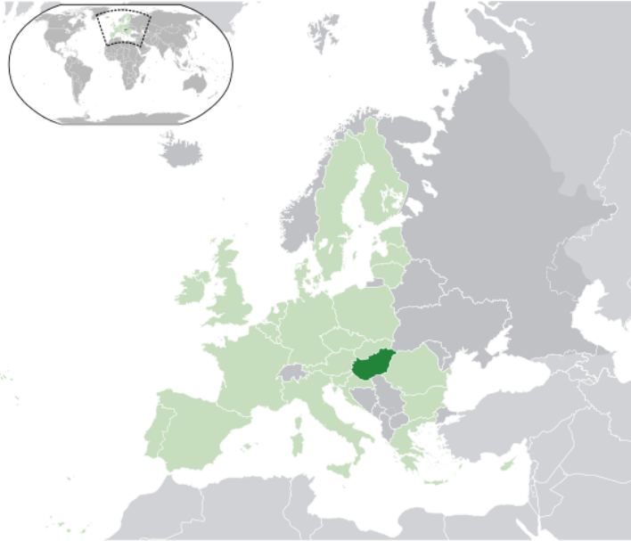
Wereldkaart met Hongarije (in donkergroen).

Hongarije ligt in Oost-Europa en grenst aan Slowakije, Oekraïne, Roemenië, Servië, Kroatië, Slovenië en Oostenrijk. Een flinke autorit van 13 uur brengt je in Hongarije of als alternatief vlieg je in 1 uur en 40 minuten rechtstreeks naar Boedapest.