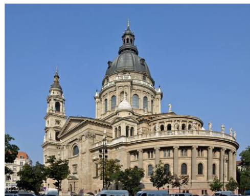
Sint Stefanusbasiliek in Budapest