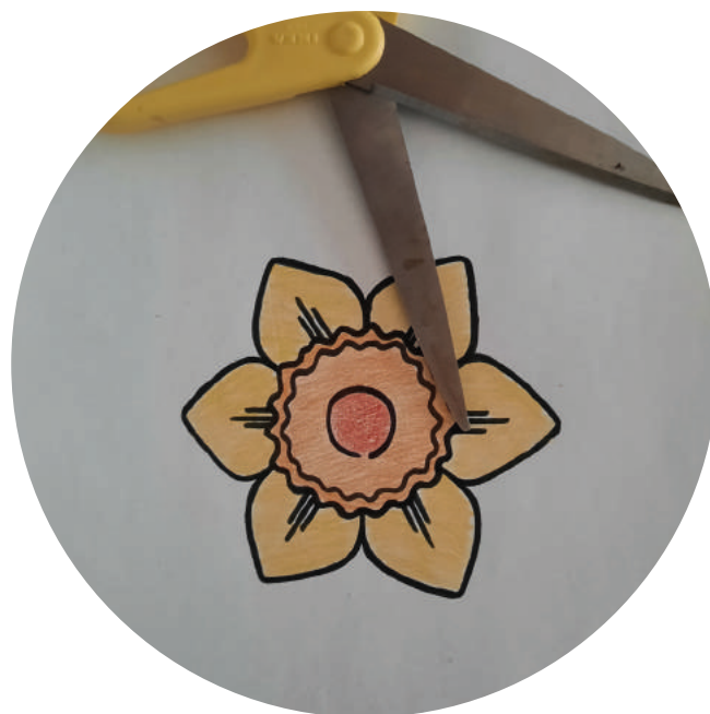
Stap 2: Knip je narcis netjes uit. Zorg ervoor dat je de randen van de blaadjes goed doorknipt en niet in je cirkel knipt.