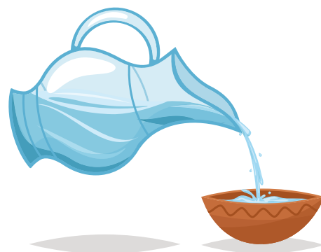
Stap 4: Vul een kommetje of een diep bord met een klein laagje water. Leg je bloem op het water en kijk wat er gebeurt.....