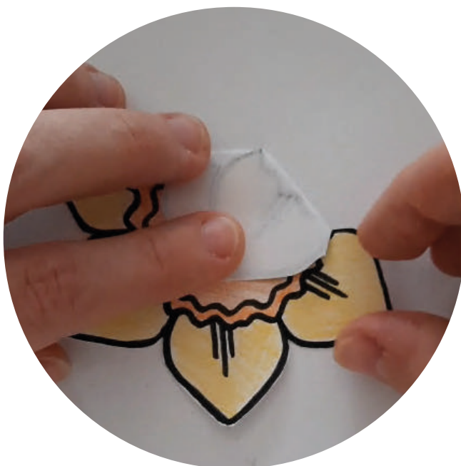
Stap 3: Vouw de bloemblaadjes van je narcis naar binnen.