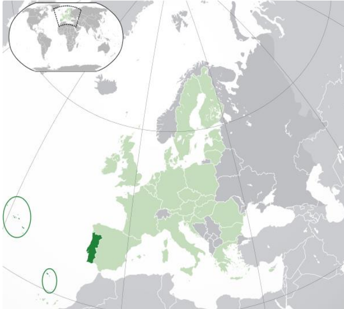
Wereldkaart met Portugal (in donkergroen) en de eilandengroepen Madeira en de Azoren (omcirkeld).

Portugal ligt in Zuid-Europa. Het grenst aan Spanje en de Atlantische oceaan. Bij Portugal behoren ook eilandgroepen Madeira en de Azoren. Met de auto is het ongeveer 21 uur rijden naar Portugal. Vliegen gaat een stuk sneller: na 2,5 uur sta je in de hoofdstad Lissabon.