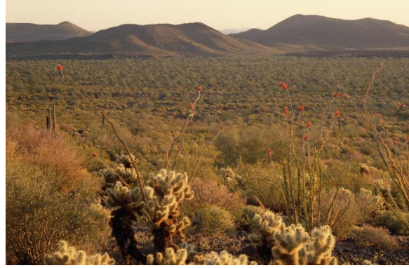
Planten in de Sonora woestijn