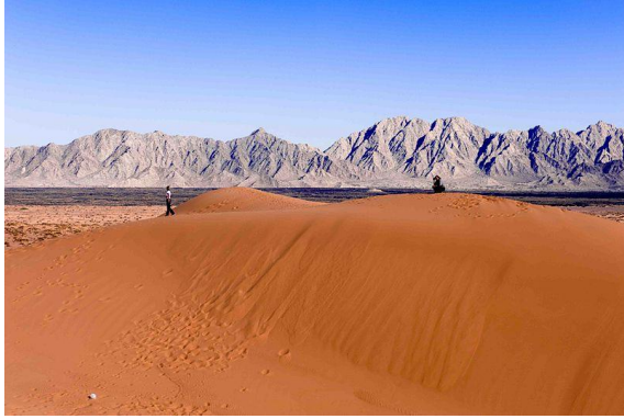
Zandduinen en rotsen