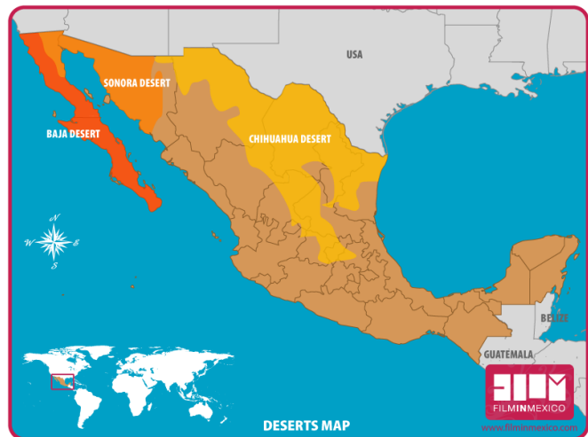
Kaart van Mexico met de Sonora-woestijn (oranje).