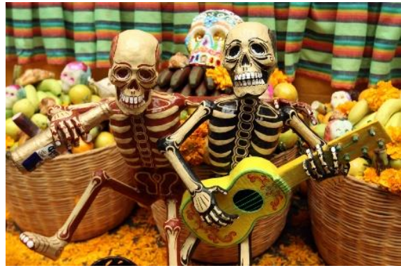
Dia de los Muertos