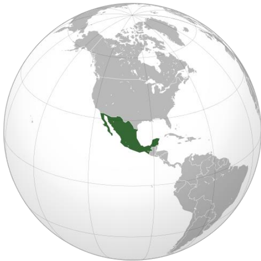
Wereldkaart met Mexico (donkergroen).

Mexico ligt in Noord-Amerika en grenst aan de Verenigde Staten, Belize en Guatemala. Het grootste deel van Mexico is echter omgeven door zee: de Stille Oceaan in het westen en de Golf van Mexico in het oosten. De reis naar de Sonora woestijn in Mexico duurt wel even: vanuit Amsterdam gaat er een rechtstreekse vlucht naar de hoofdstad Mexico-Stad die 10,5 uur duurt. Vervolgens brengt een binnenlandse vlucht van bijna 3 uur je in Hermosillo, in de Sonora woestijn.