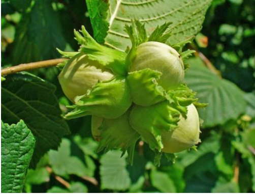
Hazelnoten, nog groen en onrijp aan de boom.

Naast de wilde hazelaar zijn er commercieel verbouwde hazelaars. Deze bomen hebben grote noten met weinig vliezen. De rassen zijn ontstaan uit kruisingen tussen diverse soorten. De kleinere noten van de wilde hazelaar worden echter gewaardeerd om hun meer uitgesproken smaak.