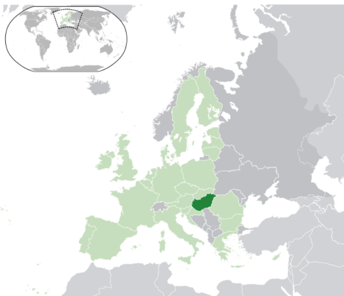
Wereldkaart met Hongarije (in donkergroen).

Hongarije ligt in Oost-Europa en grenst aan Slowakije, Oekraïne, Roemenië, Servië, Kroatië, Slovenië en Oostenrijk. Een flinke autorit van 13 uur brengt je in Hongarije of als alternatief vlieg je in 1 uur en 40 minuten rechtstreeks naar Boedapest.